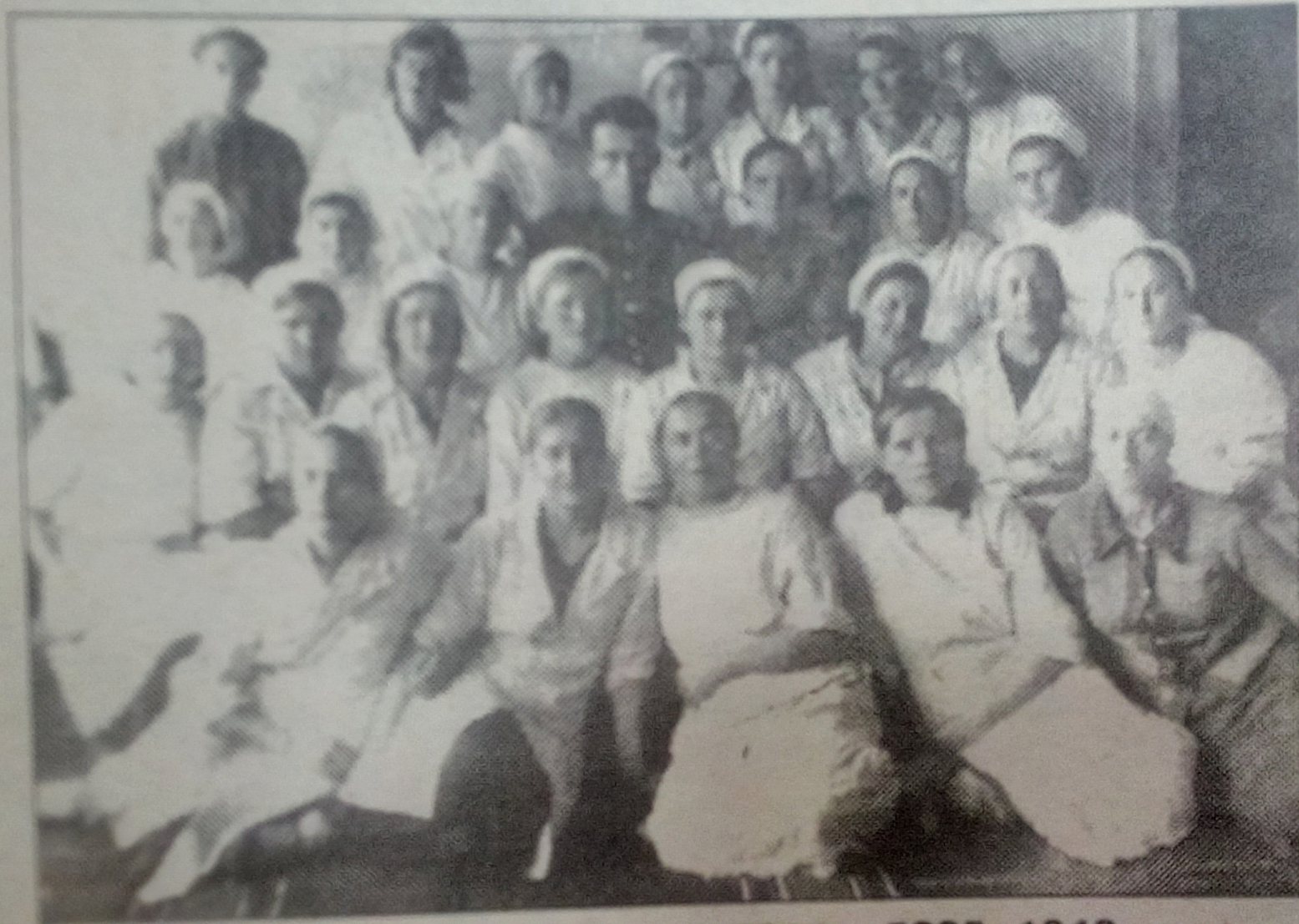
Медперсонал эвакогоспиталей 3314 и 5885. 1943 г.