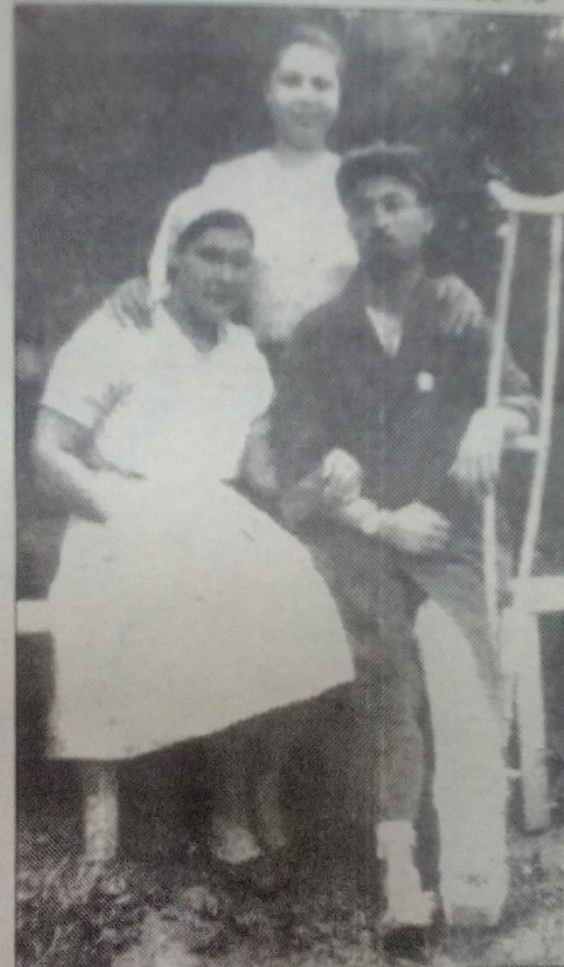
Эвакогоспиталь 3314. Тяжелораненый и медсестры на прогулке. Май 1942 г.