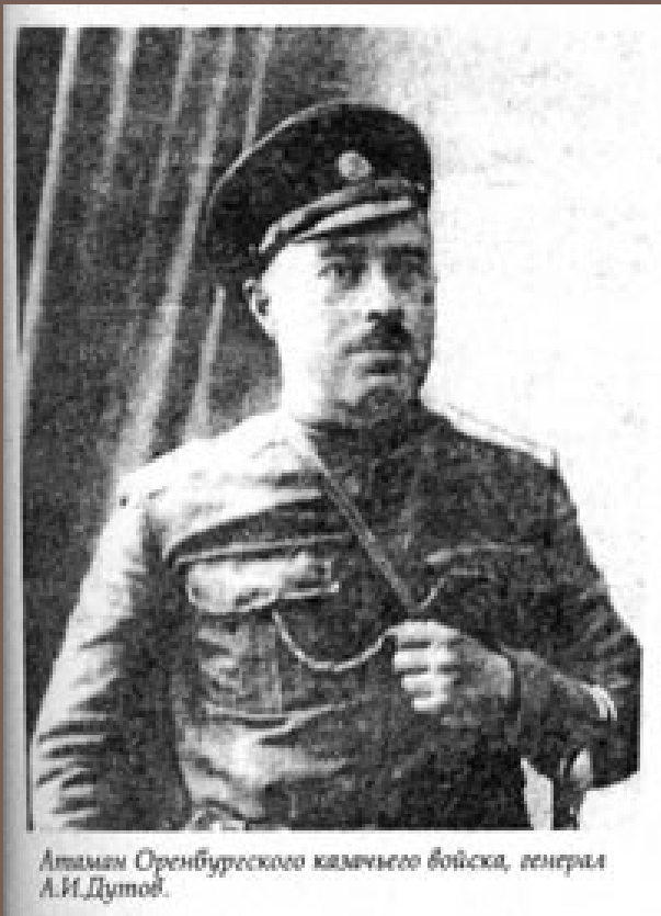
Атаман Оренбургского казачьего войска, генерал А.И.Дуров.

ЖИЗНЬ И БОРЬБА АТАМАНА ДУТОВА ПО-ПРЕЖНЕМУ ВЫЗЫВАЕТ МНОГО СПОРОВ. ОДНИ ПО-ПРЕЖНЕМУ СЧИТАЮТ ЕГО БАНДИТОМ И ВРАГОМ СОВЕТСКОЙ ВЛАСТИ, ДРУГИЕ – ГЕРОЕМ РОССИИ, БОРОВШИМСЯ ПРОТИВ КОММУНИСТОВ ЗА ДЕМОКРАТИЧЕСКУЮ РОССИЮ.