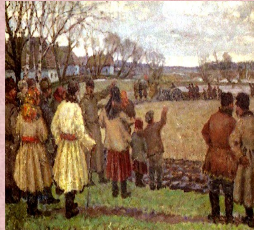
В. Крихатский «Первый трактор»