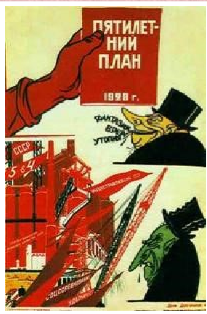
В.Дени.Н.Долгоруков. 1-й пятилетний план.