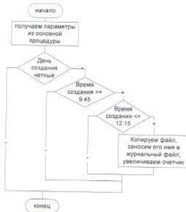
Рисунок 2 – Блок-схема процедуры third

Блок –схема процедуры third представлена на рисунке 2.