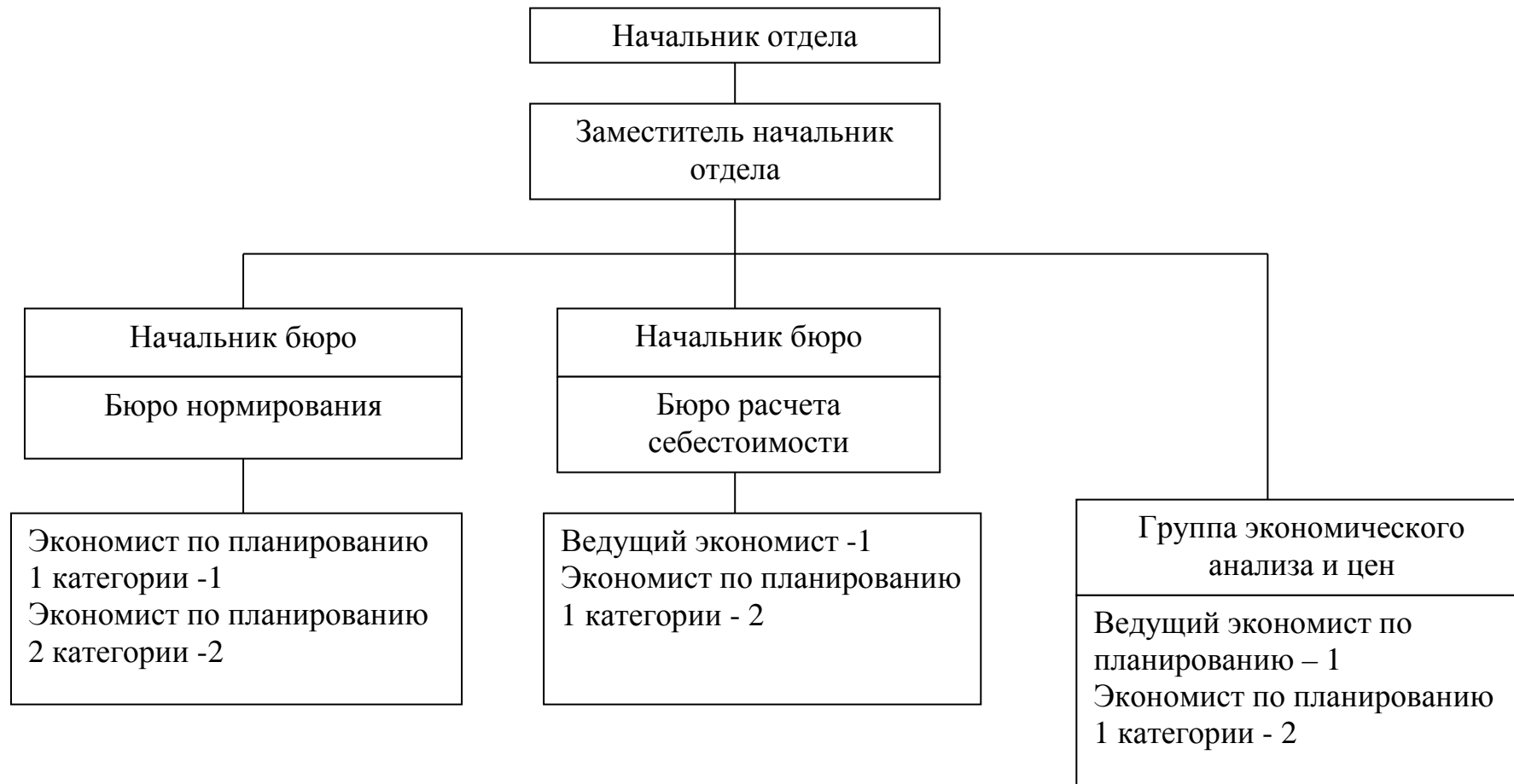
Рисунок И.2 - Организационная структура планово-экономического отдела