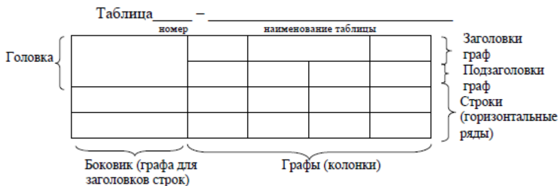
Рисунок 1 – Основные элементы таблицы

Заголовки граф и строк таблицы следует писать с прописной буквы в единственном числе, а подзаголовки граф – со строчной буквы, если они составляют одно предложение с заголовком, или с прописной буквы, если они имеют самостоятельное значение. В конце заголовков и подзаголовков точки не ставятся. Заголовки граф, как правило, записывают параллельно строкам таблицы, но допускается и перпендикулярное их расположение.